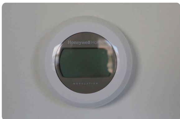
Thermostaat in de slaapkamers.

Ook in twee slaapkamers hangen thermostaten. Hiermee kunt u de temperatuur voor de slaapkamers instellen. Net als in uw woonkamer duurt het even om de temperatuur aan te passen