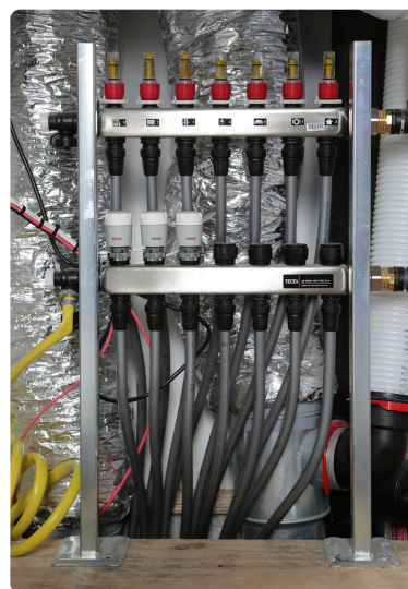
De slangen van de vloerverwarming.