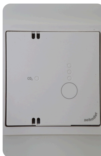
De bediening van de Warmte-Terug-Win-installatie