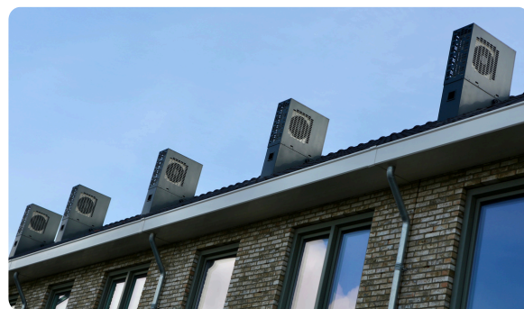
Op het dak staat de buitenunit van warmtepomp.

In uw vloer zitten slangen van de vloerverwarming. Door de slangen loopt warm water waarmee uw woning verwarmd wordt. De slangen komen samen op de zolder. De slangen vrij, het is belangrijk dat u hier niets tegen aan zet, anders kunnen deze kapot gaan.