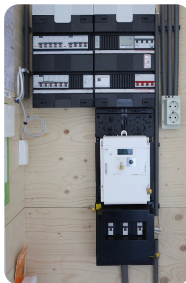
Slimme meter in de meterkast.