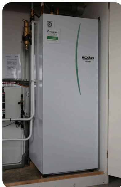
De boiler staat op zolder.

Voor warm water in uw woning heeft u een warmtepomp met een boilervat van ongeveer 150 liter. Als de 150 liter warm water op is dan moet de warmtepomp het water opnieuw verwarmen.