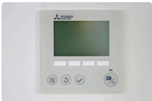
Thermostaat in de woonkamer.

Wij raden daarom af de temperatuur lager te zetten als u een dagje weg bent. Bij een vakantie kunt u de temperatuur wel een paar graden lager zetten.