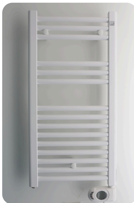
Elektrische radiator in de badkamer.

In de badkamer hangt een elektrische radiator voor extra warmte. Deze radiator is voor kort gebruik omdat deze niet energiezuinig is. U zet de radiator aan met het aan/uit knopje.