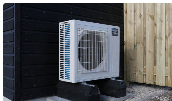
In uw tuin staat de buitenunit van warmtepomp.

In uw vloer zitten slangen van de vloerverwarming. Door de slangen loopt warm water waarmee uw woning verwarmd wordt. De slangen komen samen op de zolder en onder de trap. Onder de trap staat hier een plaat voor. Hier kunt u dus niet bij komen. Op zolder staan de slangen vrij. Het is belangrijk dat u hier niets tegen aan zet, anders kunnen deze kapot gaan.