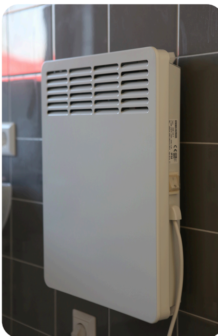
Elektrische radiator in de badkamer.

In de badkamer hangt een elektrische radiator voor extra warmte. Deze radiator is voor kort gebruik omdat deze niet energiezuinig is. U zet de radiator aan met het aan/uit knopje.