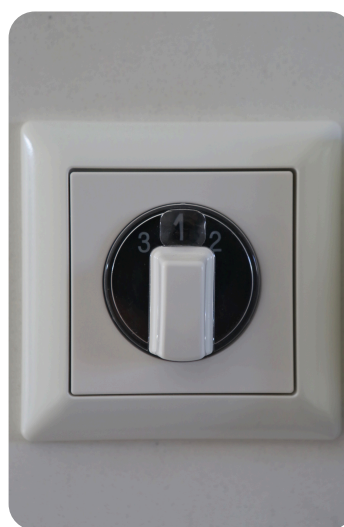
De bediening van de Warmte-Terug-Win-installatie