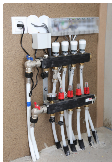
De slangen van de vloerverwarming.