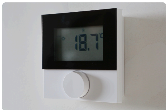
Thermostaat in de slaapkamers.

Ook in de slaapkamers hangen thermostaten. Hiermee kunt u de temperatuur voor de slaapkamers instellen. Net als in uw woonkamer duurt het even om de temperatuur aan te passen.