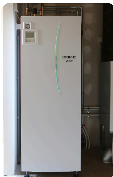
De boiler staat op zolder.

Voor warm water in uw woning heeft u een warmtepomp met een boilervat van ongeveer 150 liter. Als de 150 liter warm water op is dan moet de warmtepomp het water opnieuw verwarmen.